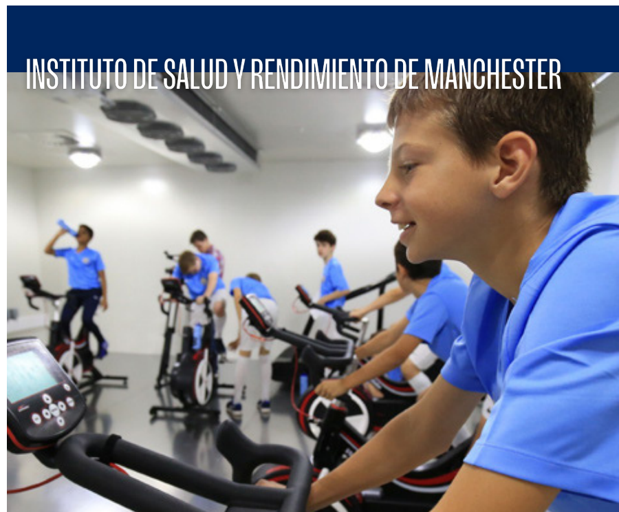
INSTITUTO DE SALUD Y RENDIMIENTO DE MANCHESTER