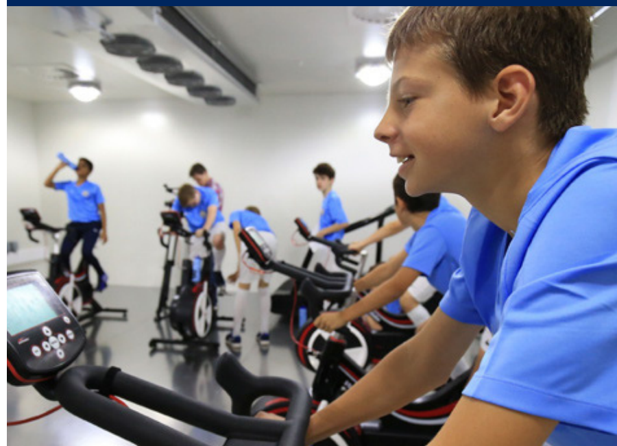
MANCHESTER INSTITUTE OF HEALTH & PERFORMANCE